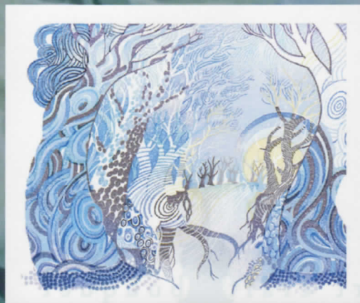
消しゴム版画 アオヤマヤスコ